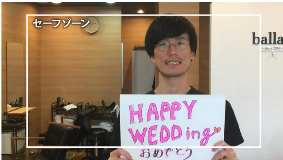
悪い例 文字が切れてしまいます。

撮影時は、カメラやスマートフォンを縦向きにせず、横位置で撮ってください。 ムービーの画面は横長ですので、縦位置で撮ると画面の左右に余白ができてしま います。