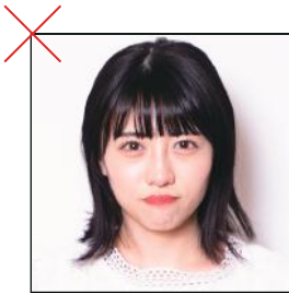
髪をおろしている