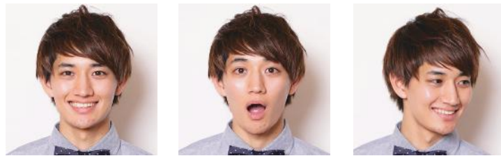
※斜めのカットの新郎は向かって右方向に