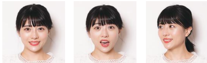
※斜めのカットの新婦は向かって左方向に