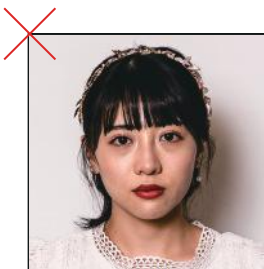
アクセサリーをつけている 顔が影になっている