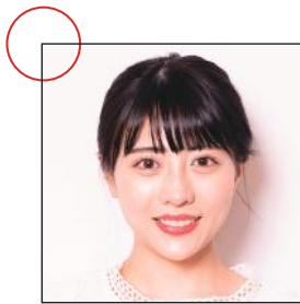
髪がまとまっている